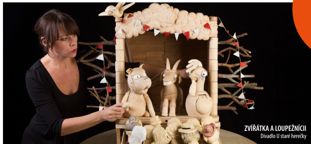
ZVÍŘÁTKA A LOUPEŽNÍCI Divadlo U staré herečky