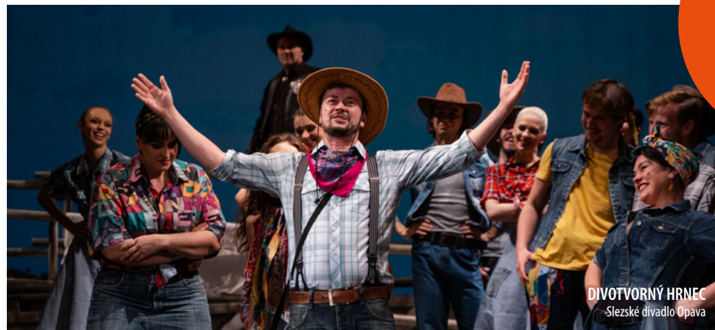
DIVOTVORNÝ HRNEC Slezské divadlo Opava