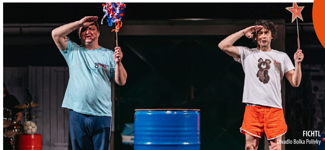
FICHTL Divadlo Bolka Polívky