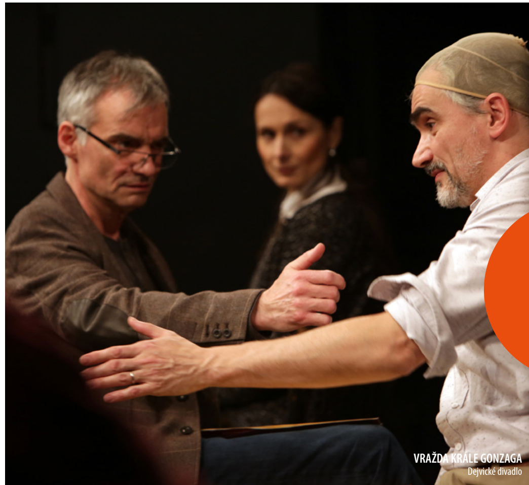
VRAŽDA KRÁLE GONZAGA Dejvické divadlo