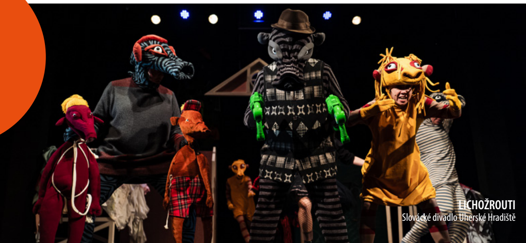
ELCHOŽROUTI Slovenské divadlo Uherské Hradiště