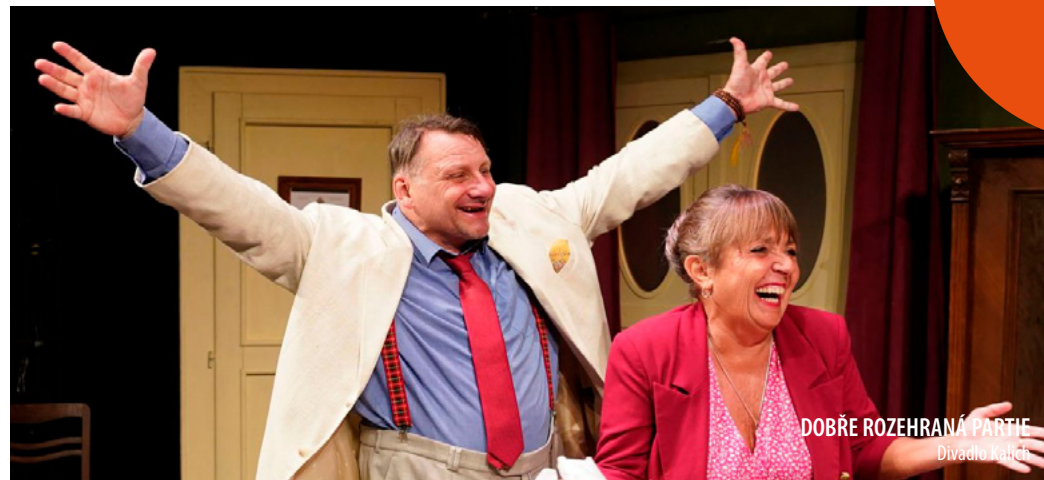
DOBŘE ROZEHRANÁ PARTIE Divadlo Kalich